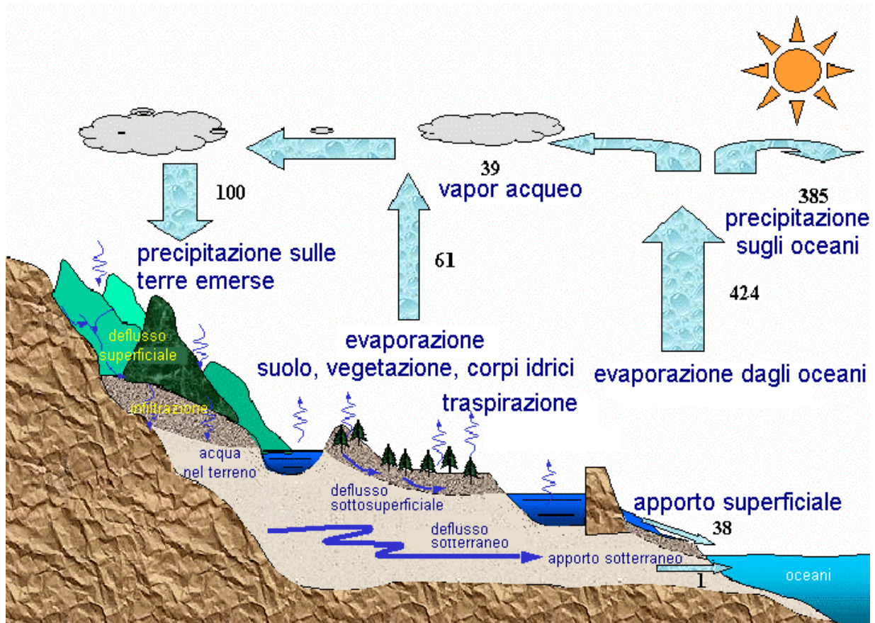
Figura 1- Flussi all'interno del ciclo idrologico. Le unità sono in termini relativi alla precipitazione annuale sulla superficie terrestre (100 = 119.000 km 3 anno -1 )

La figura rappresenta in maniera schematica il ciclo idrologico del pianeta, in cui i valori relativi alle diverse forme di trasporto sono proporzionali al valore di precipitazione sulle terre emerse che è stato posto pari a 100.